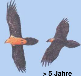
> 5 Jahre Kopf gelblich/rötlich