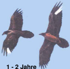
1 - 2 Jahre Markierungen deutlich

Grafiken: El Quebrantahuesos en los Pireneos (R. Heredia y B. Heredia); Ministerio de Agricultura Pesca y Alimentación. Publicaciones del Instituto Nacional para la Conservación de la Naturaleza, 1991