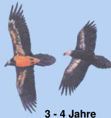
3 - 4 Jahre Kopf noch dunkel