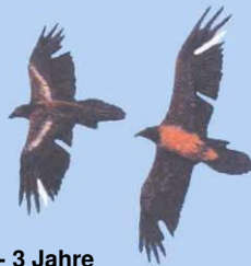
2 - 3 Jahre Markierungsreste u. Lücken