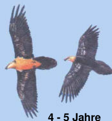
4 - 5 Jahre helle Kopffärbung